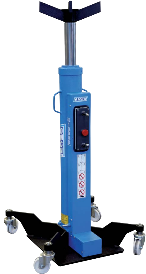
Art. SIF 6/73 IP

con stelo cromato funzionamento oleopneumatico chromium plated rod air-hydraulic functioning tige chromée fonctionnement hydropneumatique verchromter kolben pneumatisch-hydraulischer Betrieb