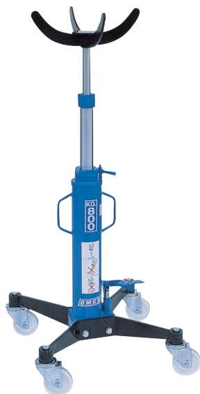
Art. SIF 7/73

a due stadi con steli cromati at two stages chromium plated rods a deux etages avec tiges chromées mit verchromten teleskopkolben