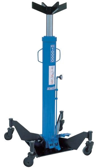
Art. SIF 6/73