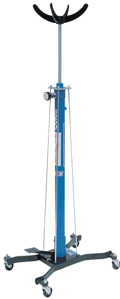
Art. SIF 1/73

con stelo cromato chromium plated rod tige chromée verchromter kolben