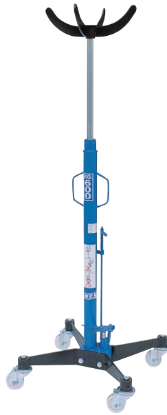
Art. SIF 2/A/73