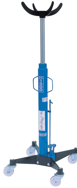
Art. SIF 3/73