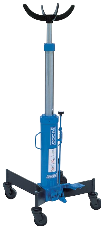
Art. SIF 10/73